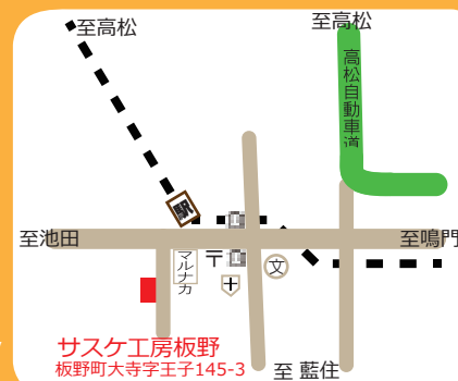
サスケ工房板野 板野町大寺字王子145-3